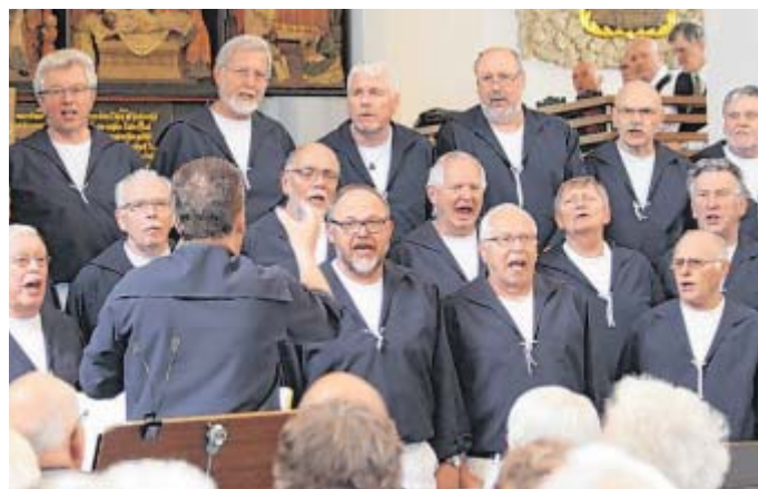
Seemannslieder und Anekdoten: Der Shanty Chor Bünde beim Auftritt in Kirchlengern.

songs – kamen gut beim Publikum an. Den Abschluss bildeten die Shantys mit „Kein schöner Land“. Das Frühlingskonzert – ein ziemlich breit gefächertes Männerkonzert aus unterschiedlichen Musikrichtungen – hinterließ ein zufriedenes Publikum.