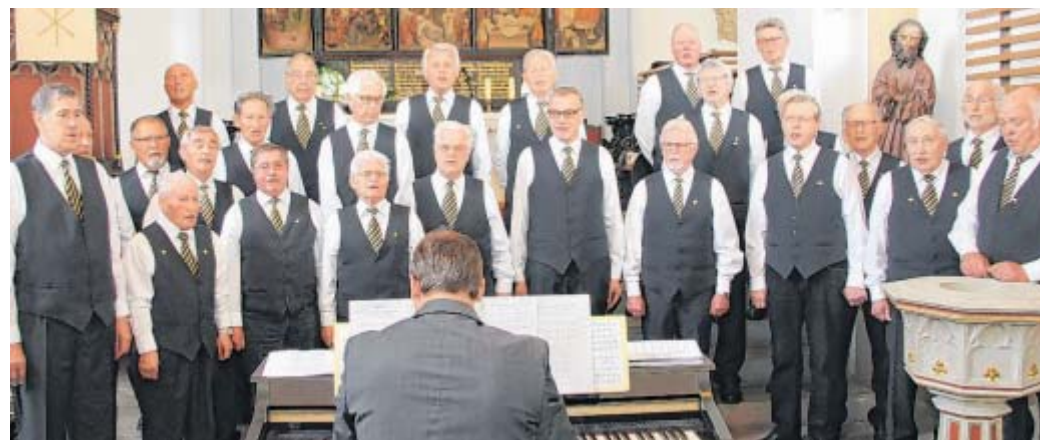
Adrett und stimmgewaltig: Die Chorgemeinschaft MG 1898 Stift Quernheim/GV Deutsche Eiche Kirchlengern.